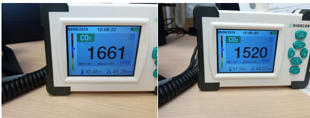
Medicions de temperatures on es pot veure que superen els 31°C.

Després de més de dues setmanes, amb diverses onades de calor, on s'ha pogut verificar que l'edifici supera àmpliament la temperatura normativa de 27°C, arribant fins als 33°C de forma sostinguda . A més, s'han col·locat un aparells autònoms de refrigeració que són del tot insuficients, cal dir que aquests aparells, poden originar incendis per sobrecarrega de les instal·lacions elèctriques.